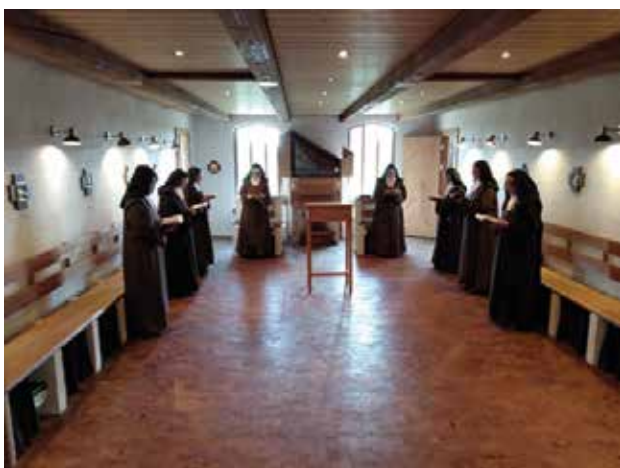
Skt. Josefs Karmel, Hillerød

"En karmeliterindes missionsiver bør omfatte hele verden", skriver den Lille Therese i sine selvbiografiske skrifter. Selv havde hun to præster i missionen, som hun fik til opgave at bede særligt for. Men hun håbede, at med Guds nådes hjælp kunne hendes bøn være til gavn for mere end to missionær-